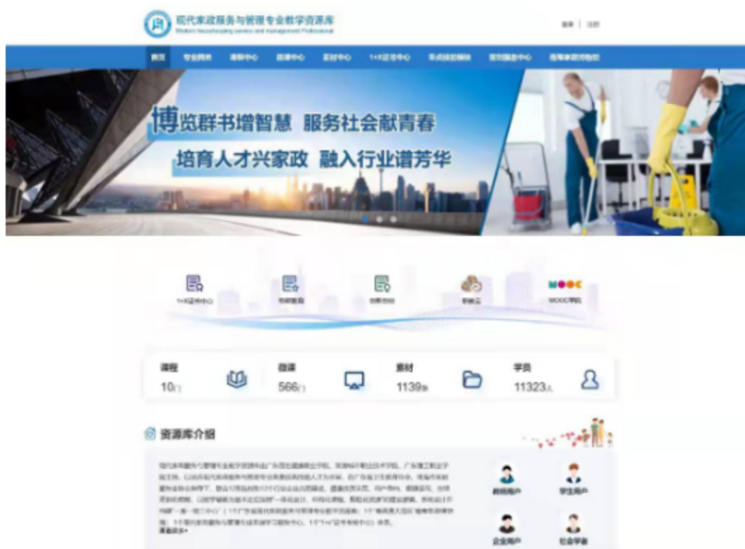
图为 现代家政服务与管理专业教学资源库网页截图

药学系积极参加广东省高职教育医药卫生类专业教指委 2018 年度教育教学改革重点课题-广东省高职教育药学专业、中药学专业《实训教学标准》和《实训室建设标准》