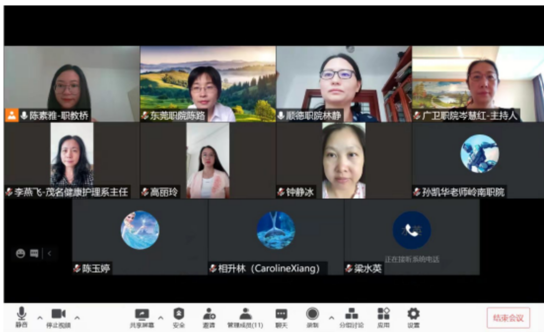
图为护理专业人才培养方案编制和核心课程标准编制线上会议