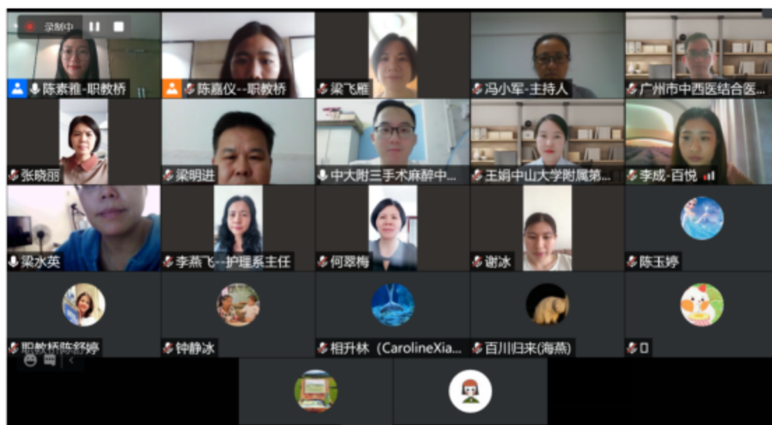
图为职业能力分析职业能力分析、课程体系构建线上会议