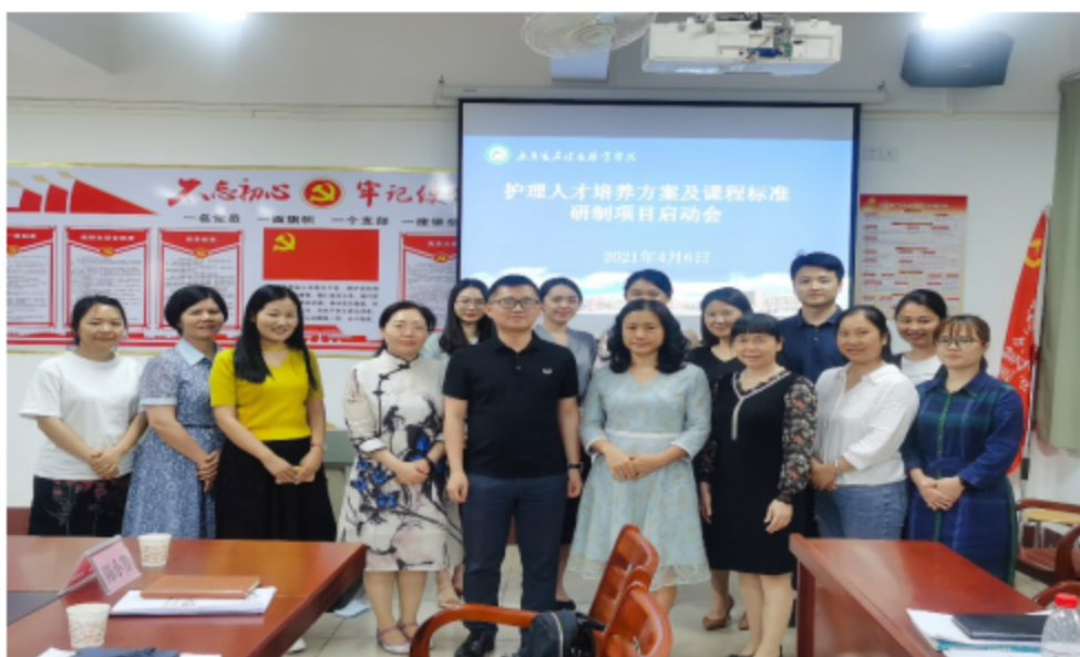
图为护理人才培养方案及课程标准研制项目启动会